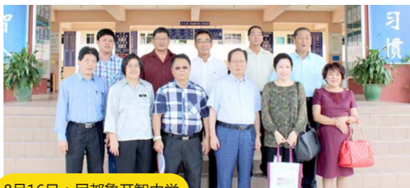
8月16日：民都鲁开智中学