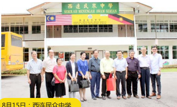
8月15日：西连民众中学