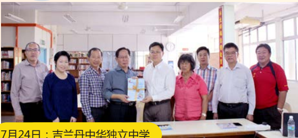
7月24日：吉兰丹中华独立中学