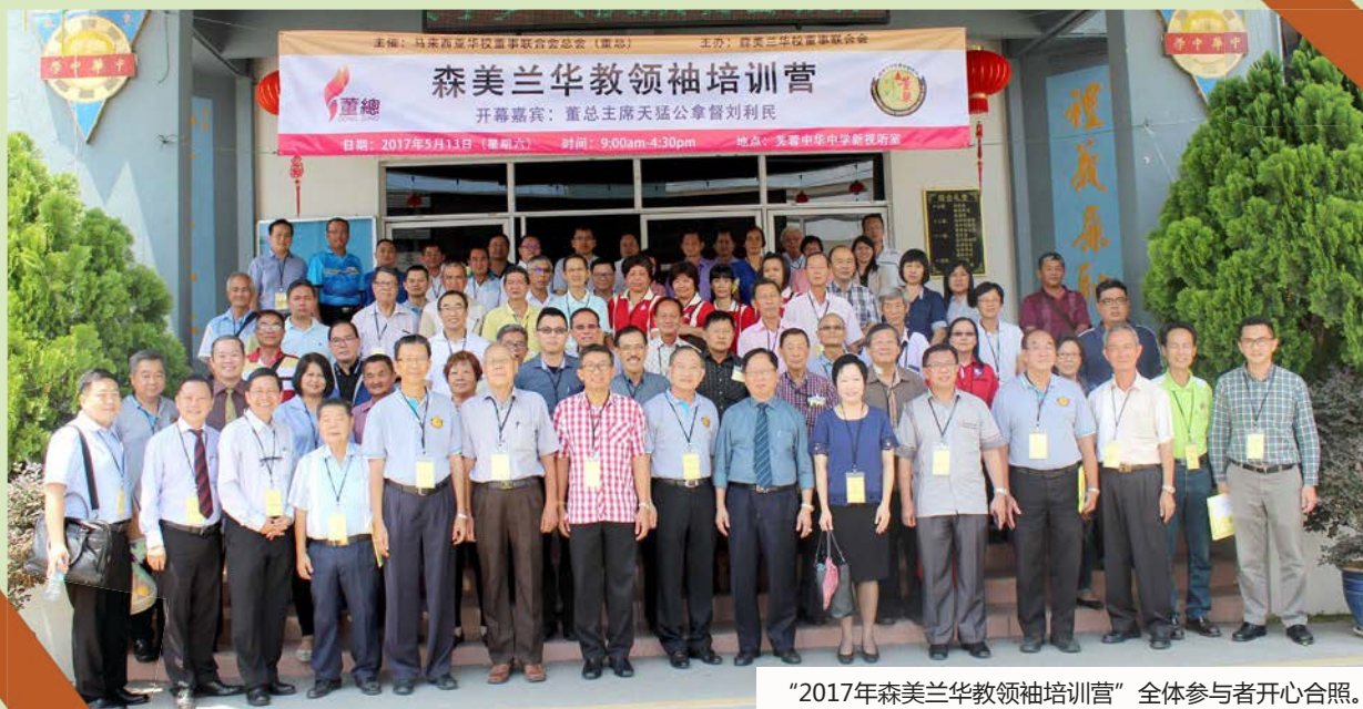
“2017年森美兰华教领袖培训营”全体参与者开心合照。

他也表示，在华小迁校的课题上，华社必须认清“大原则”和“策略上的需要”的区分。换言之，今天华社同意让华小迁校，是因为策略上的需要，以在仅有的空间，想方设法来达到增建华小的目的。而我们的大原则就是要争取政府实施公平的政策，按照处理国小建校的方式，根据各族人口的结构，在有需求的地区，主动拨地拨款兴建各源流小学，包括华小。