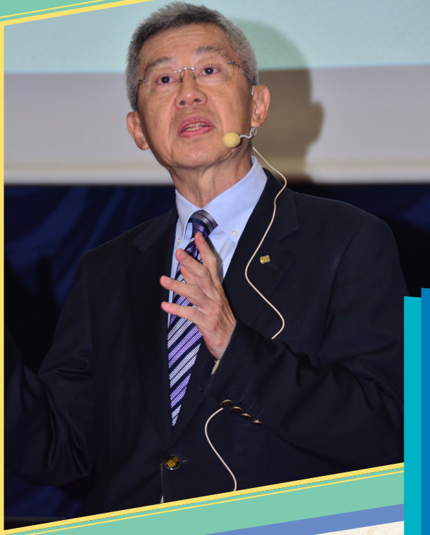
程介明教授主题演讲。