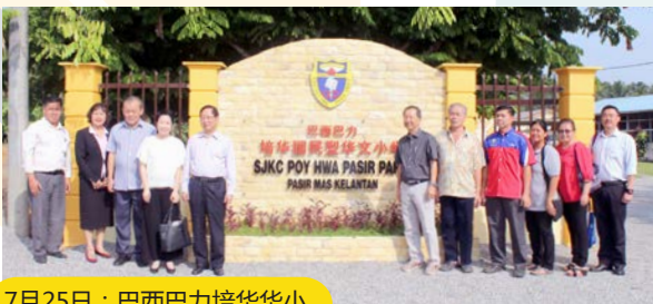
7月25日：巴西巴力培华华小