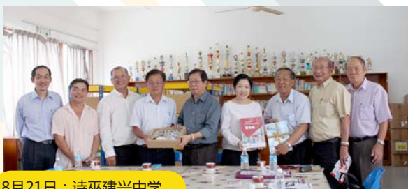
8月21日：诗巫建兴中学