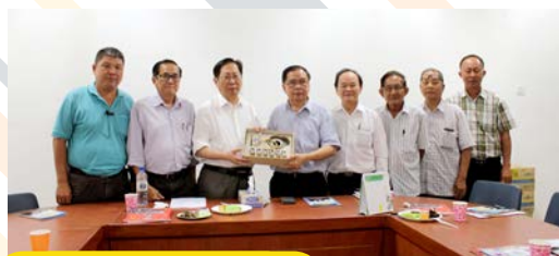
6月5日：笨珍培群独立中学