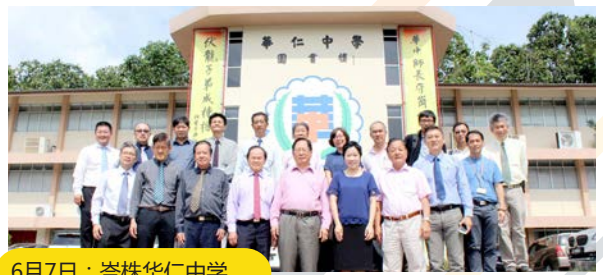
6月7日：峇株华仁中学