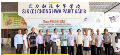
6月6日：巴力加礼中华华小