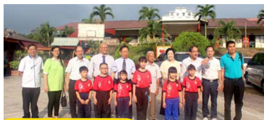
5月14日：津津培贤华小