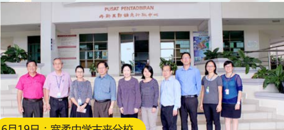
6月19日：宽柔中学古来分校