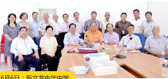
6月6日：新文龙中华中学