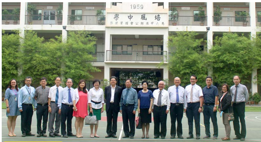
5月13日：马六甲培风中学