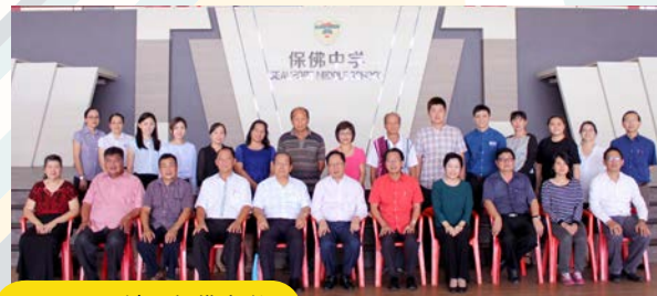
7月10日：沙巴保佛中学