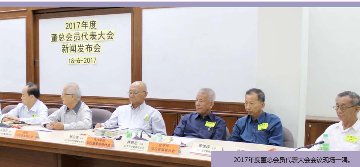
2017年度董总会员代表大会会议现场一隅。