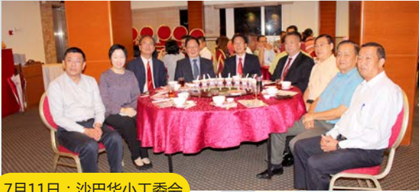
7月11日：沙巴华小工委会