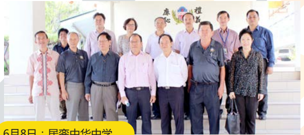
6月8日：居銮中华中学