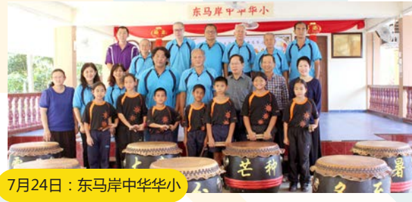
7月24日：东马岸中华华小