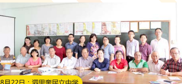
8月22日：泗里奎民立中学