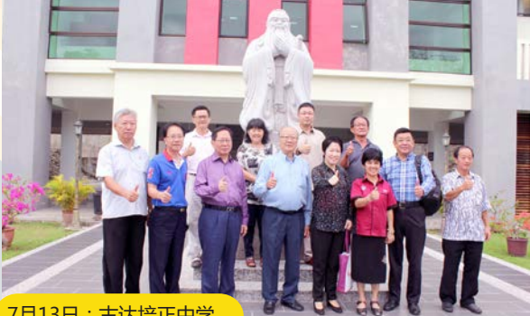
7月13日：古达培正中学