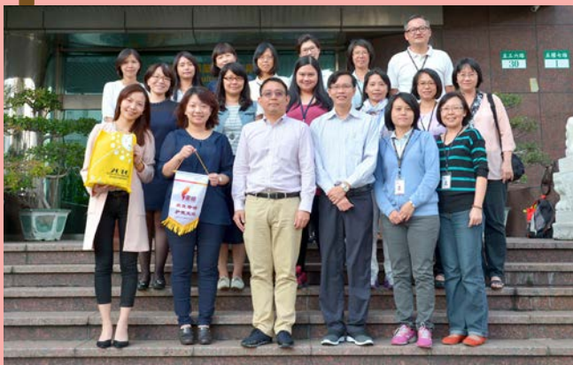
参访团与龙腾出版社代表合影。

最后一站，我们拜访龙腾文化事业有限公司，龙腾出版社的代表先为我们介绍公司的组织架构及解说有关教材编撰及出版的作业流程，我们觉得龙腾出版社的组织完善，且各部门人员充足，其教材的编篡和出版过程也很严谨，值得我们参考借鉴。参观完该公司各部门之后，双方也特别针对教材的编撰细节进行交流。