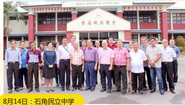
8月14日：石角民立中学