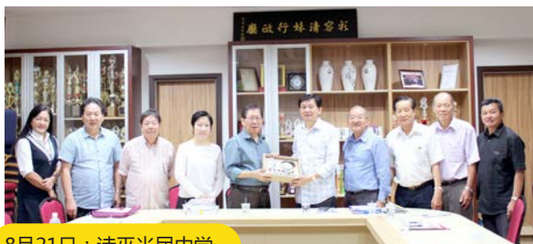
8月21日：诗巫光民中学