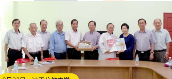
8月22日：诗巫公教中学