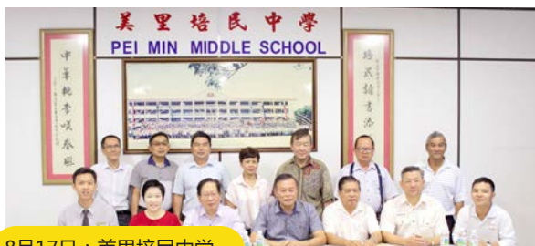
8月17日：美里培民中学