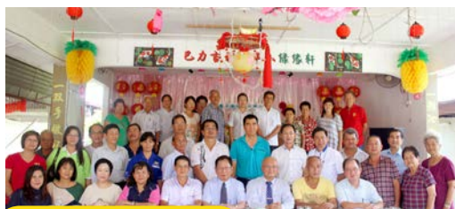
5月14日：巴力吉利令华小