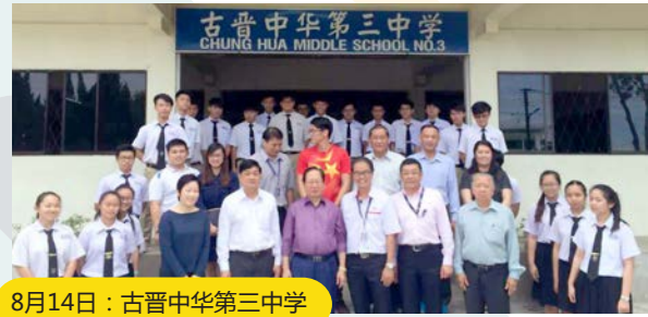
8月14日：古晋中华第三中学