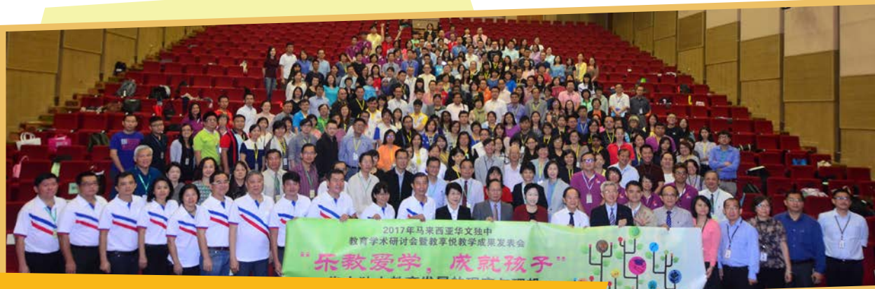
“2017年马来西亚华文独中教育研讨会暨教享悦教学成果发表会”获得近300名来自各地的与会者踊跃出席。

5月28至29日，董总于巴生兴华中学举办“2017年马来西亚华文独中教育学术研讨会暨教享悦教学成果发表会”。本次大会主题为“乐教爱学，成就孩子——华文独中教育的现实与理想”。董总希望透过举办类似活动，鼓励华文独中教育工作者从事教育研究，借由教学实务的反省和学理的分析，为华文独中教育改革探寻新的方向和出路，同时提供给华文独中教师及社会人士在同一个平台上呈现及分享论文或教学课件。这次研讨会共有近300位来自全国各地的华文独中教育工作者、专家学者等，齐聚一堂进行交流及教学的分享，其中学术论文有26篇及67个教案课件作品。