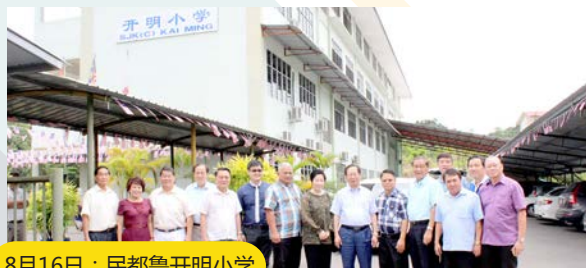
8月16日：民都鲁开明小学