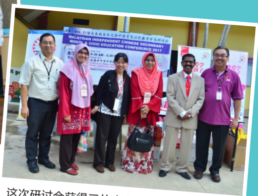
这次研讨会获得三位来自苏丹依德里斯教育大学的友族学者，就政府学校体系下的德育及公民教育落实情况提供观察心得，实属难能可贵。