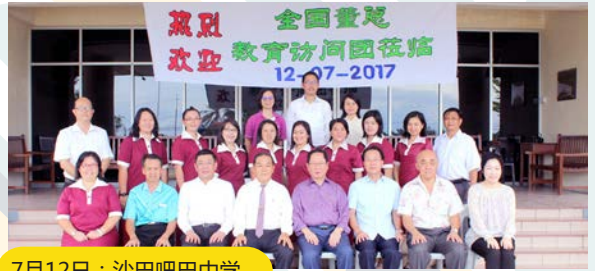
7月12日：沙巴吧巴中学