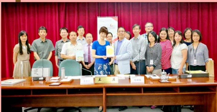
参访团与国教院代表合影。

第四站拜访台湾国家教育研究院三峡总院。大家针对学校本位课程如何开发师资团队，以及开发跨领域校订课程和学校办学方向等课题进行交流。