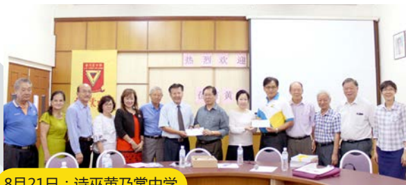
8月21日：诗巫黄乃裳中学