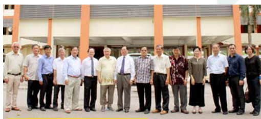
6月5日：利丰港培华独立中学