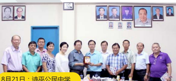
8月21日：诗巫公民中学