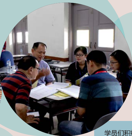
学员们积极参与分组讨论。