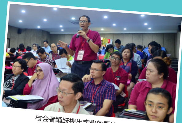
与会者踊跃提出宝贵的看法和意见。