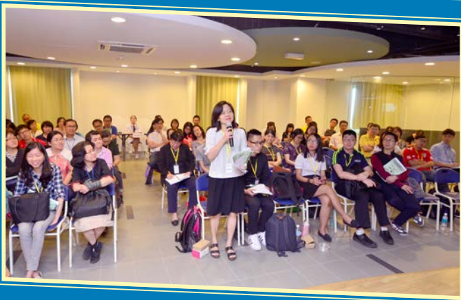
教享悦教学成果发表会上的教师问答环节。