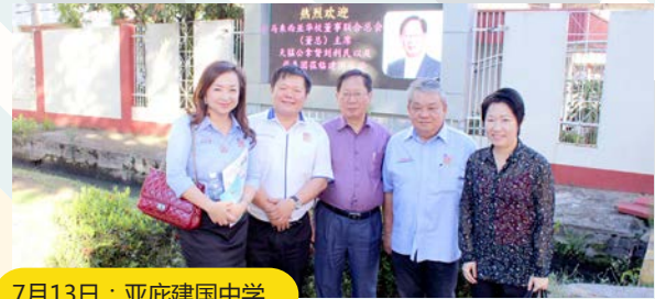
7月13日：亚庇建国中学