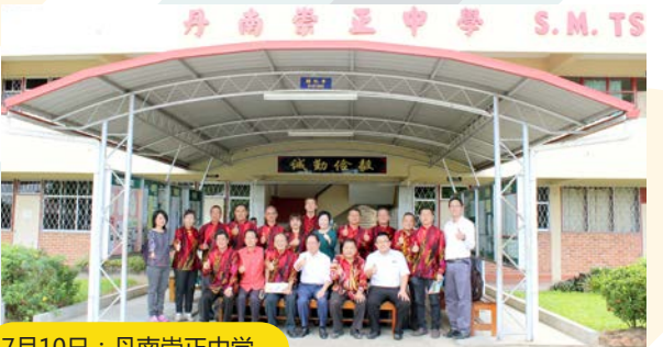
7月10日：丹南崇正中学