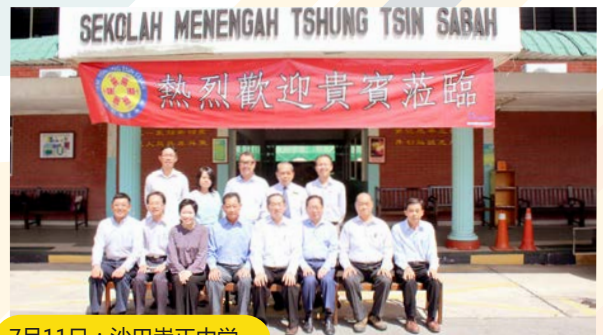
7月11日：沙巴崇正中学