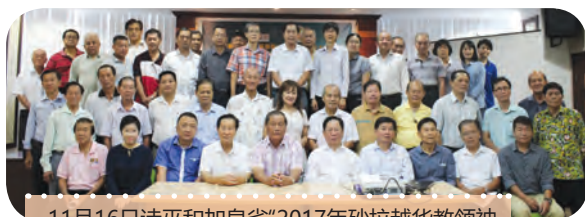
11月16日诗巫和加帛省“2017年砂拉越华教领袖工作坊”参与者合影。