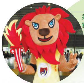
第九届全国华文独中球类锦标赛吉祥物“小吉”。