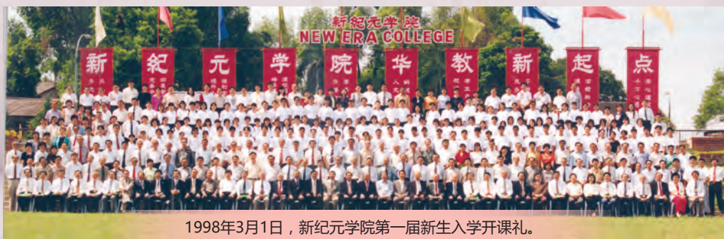
1998年3月1日，新纪元学院第一届新生入学开课礼。