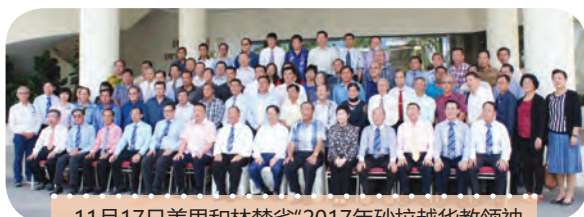
11月17日美里和林梦省“2017年砂拉越华教领袖工作坊”，获得华校董事校长们的踊跃出席。