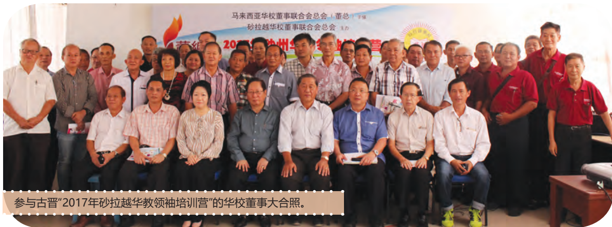
参与古晋“2017年砂拉越华教领袖培训营”的华校董事大合照。

董总自2016年起，每年赞助各州董联会或董教联合会举办华教领袖营，从而栽培州内的华教领袖，同时加强华教队伍的凝聚力，成为华教运动的生力军。领袖营的另一目的，就是期望透过培训让董事们了解本身的职责和权利。华校董事会是学校的保姆，董事会在捍卫和发展华文教育上扮演着重要的角色。只有通过不断地讨论和交流，才能互相学习，取长补短，才能够加强大家对华教政策与课题的认识。