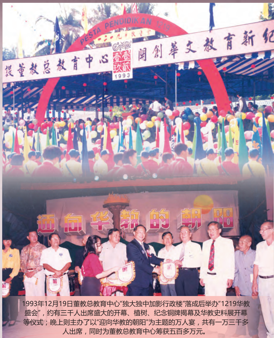
1993年12月19日董教总教育中心“独大独中加影行政楼”落成后举办“1219华教盛会”，约有三千人出席盛大的开幕、植树、纪念铜牌揭幕及华教史料展开幕等仪式；晚上则主办了以“迎向华教的朝阳”为主题的万人宴，共有一万三千多人出席，同时为董教总教育中心筹获五百多万元。