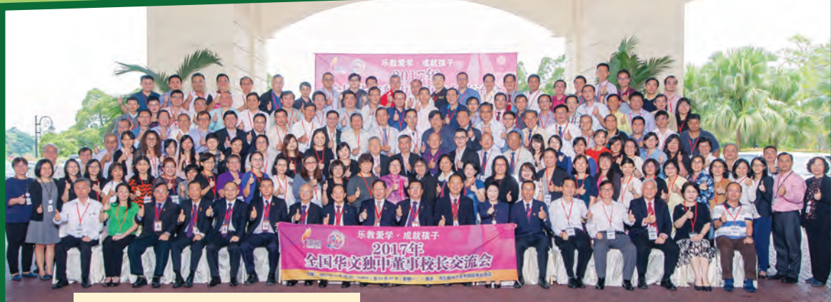
全体与会者拍摄大合照留念。

“乐教爱学•成就孩子”2017年全国华文独中董事校长交流会已于11月25日至27日，一连三天在雪兰莪万宜布特拉再也酒店顺利举行。此次的交流会获得48所独中共146名董事、校长、副校长及行政主管出席。