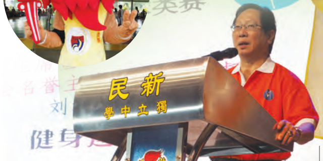
董总主席天猛公拿督刘利民为“2017年全国华文独中球类锦标赛”开幕仪式致词。