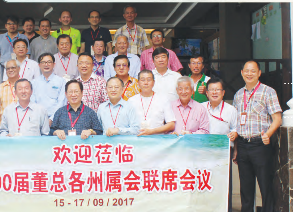
各州属会代表在登嘉楼浪中岛夏日海湾度假村内合照留念。