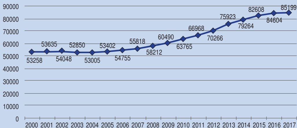
图表1：2000年至2017年全国华文独中学生人数

根据《中国报》于2017年10月19日的报道，雪隆区八华文独中2018年新生报考人数一如往年热烈，但碍于学额有限，至少有2500名学生被拒门外。虽然尊孔独中、吉隆坡中华独中和坤成中学皆正进行新校舍兴建工程，但目前还是无法舒缓雪隆区华文独中学生爆满而导致许多学生不得入读的问题。