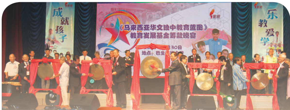
嘉宾为《马来西亚华文独中教育蓝图》教育发展基金筹募晚宴主持鸣锣擂鼓仪式。