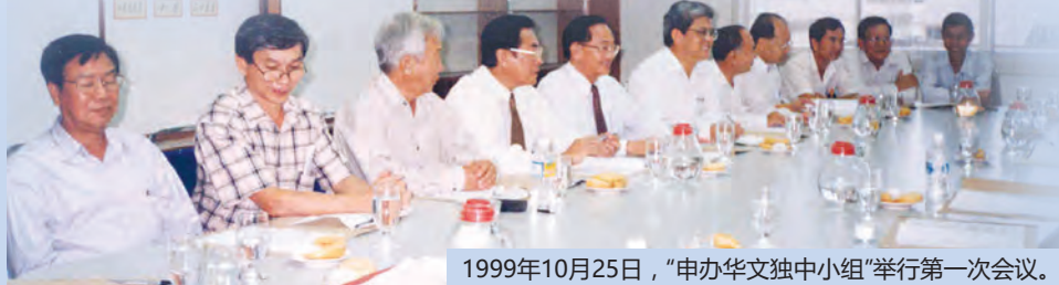
1999年10月25日，“申办华文独中小组”举行第一次会议。