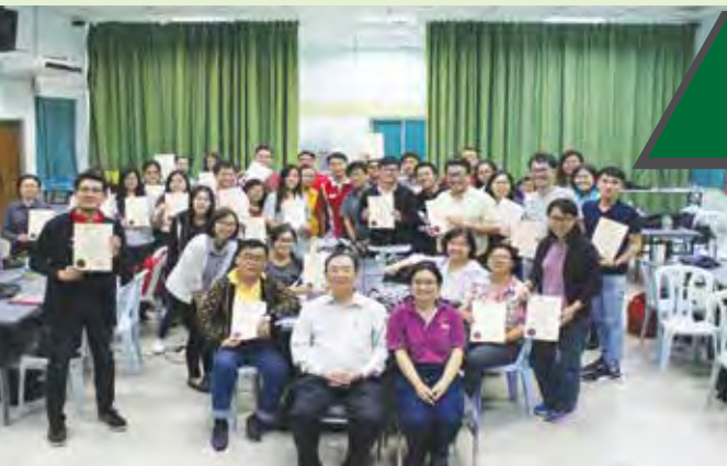
参与“全国独中经济学老师培训”活动的全体学员与老师合照。

在马来西亚开斋节假期间，董总课程局于6月16日至17日举办“全国独中经济学老师培训”，宗旨是培训新手经济学教师，提升教师的教学素质。参加这项培训课程的老师来自18所不同的华文独中，共有31位经济学科的老师出席；其中东马老师有3位，西马老师有29位。