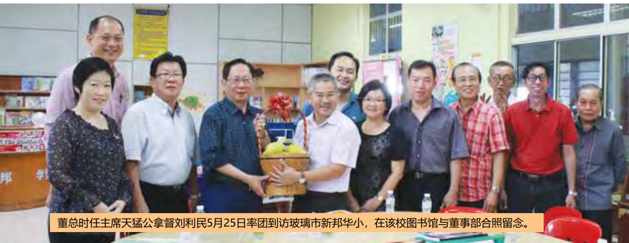
董总时任主席天猛公拿督刘利民5月25日率团到访玻璃市新邦华小，在该校图书馆与董事部合照留念。

为促进董总与霹雳州华文独中董事会之间的联系与交流，以及针对州内的华教课题进行讨论，在董总时任主席天猛公拿督刘利民的率领下，董总中央委员与行政部同仁于2018年5月19日拜访怡保培南中学与霹雳华校董事会联合会。通过与怡保培南中学董事会的交流，本会进一步认识与了解该校的发展现况，该校给予的回馈将作为华文独中教育改革与发展的参考。通过与霹雳华校董事会联合会的交流，本会得以了解该会对新州政府献议发展华教的计划，以及州内国民型华文小学、国民型中学与华文独中的发展现况与面临的困境。