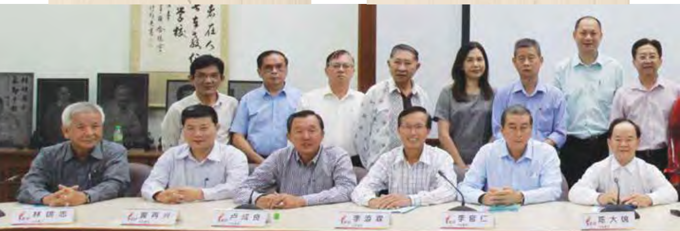
7月7日，第31届（2018年-2021年）董总中央委员会顺利产生。