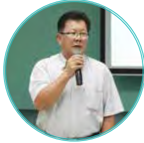
两位前领导受邀上台发表感言。