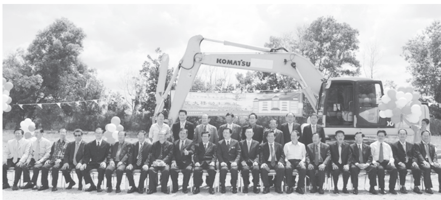
● 出席动土礼的南院董理事、卫生部长廖中莱与各华团代表合照。