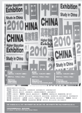
● 2010年“中国高等教育展”活动海报。