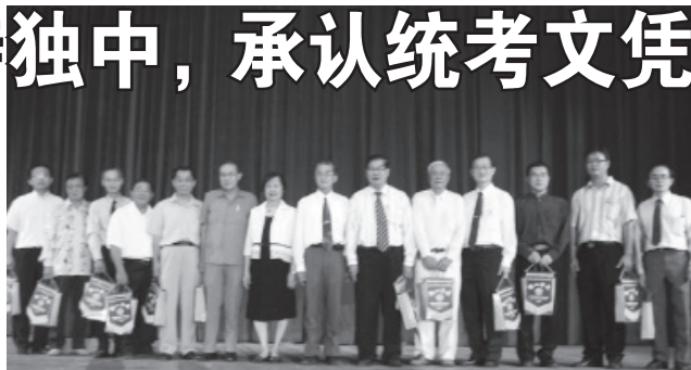
● 出席霹雳州华文独中复兴运动37周年纪念活动的嘉宾与各独中代表合影。

经过数十年的奋斗和建设，独中现在取得了丰硕的办学成果，具有一定的发展规模和学术水平。全国60所独中学生人数超过6万名；统考文凭广受欢迎，获得国外许多大专和国内私立大专接受为入学资格之一，但我国政府至今仍不承认独中统考文凭。