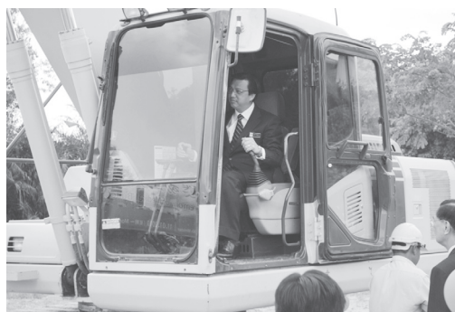
● 卫生部长廖中莱启动推土机，为中医大楼主持动土仪式。