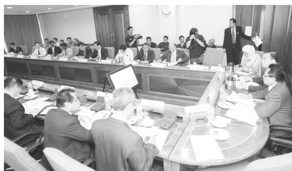
● 教育部召开小学课程改革会议。

针对《马来西亚我的国家》的教学媒介语，华印裔文教团体坚持教育部必须以华文在华小或以淡米尔文在淡小教导这个新科目，以确保达到教学的成效，而且这样才符合《1996年教育法令》的条文，即“国民型