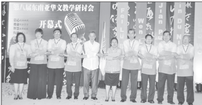
■ 董教总教育中心行政部整理