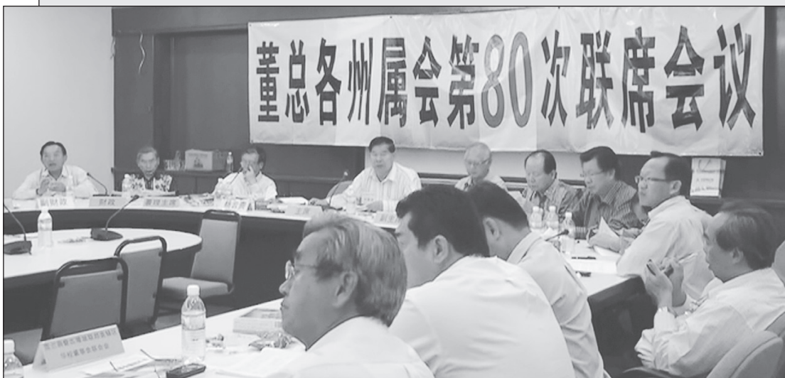
● 脚日新独中举行。 董总各州属会第80次联席会议在大山

鉴于2008年与2009年间新纪元学院事件，与会者深入探讨华教运动内部的团结和如何防止分裂的问题，取得了“以大局为重，不因小我搞分裂的共识”，将以民主和理性的态度处理一切内部可能产生的争端。