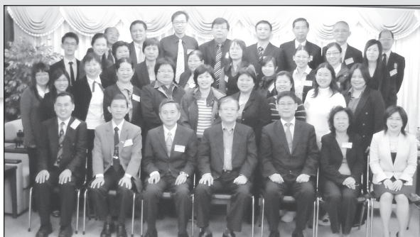
董总学生事务局整理