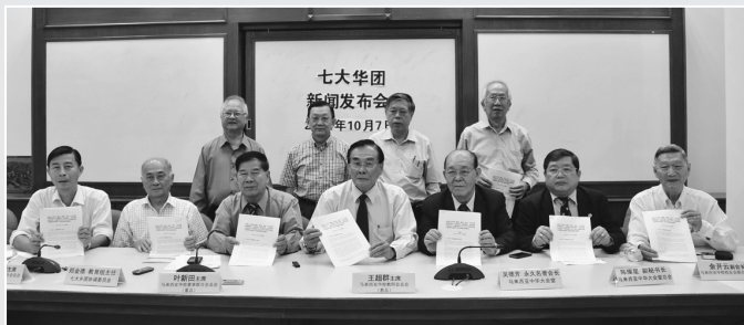
● 全国七大华团于10月7日召开新闻发布会，针对教育大蓝图提出13点看法和建议。