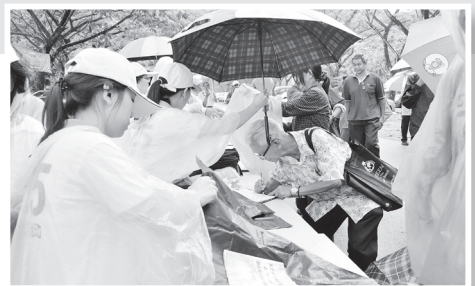
● 抵達會場後，出席者隨即到櫃台處簽名報到。