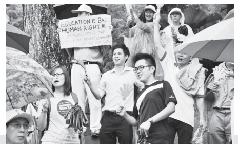
● 年輕的支持者也到場為華教打氣。