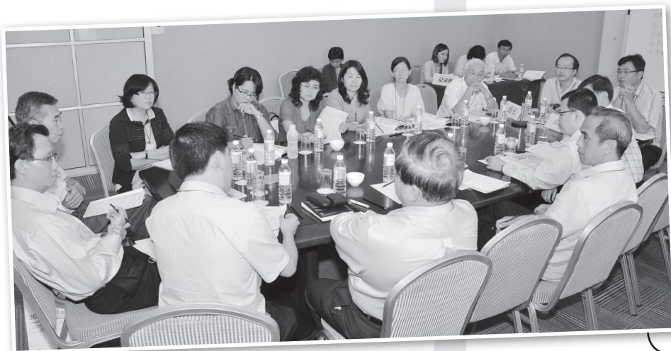
● 分组讨论与交流的情况。

最后，大会筹委会主席邹寿汉为此次交流会所报告及讨论的各项议题进行了总结，为这两天一夜的交流会写下完满的句点。