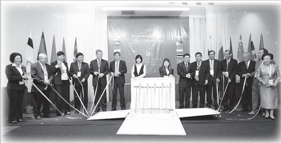
● 各国代表上台主持开幕仪式。

本届研讨会的主题为“东南亚华文教学概况及展望”，讨论的中心议题主要包括：（一）政府华文教育的政策的变迁与背景；（二）华文教育与社会运动；（三）华教对外交流现况与社会意义；（四）华教现况与展望；（五）国家与教育政策；（六）华文教学实践；（七）华文师资培训及（八）族群文化认同与意识的培育，各国代表针对以上议题进行了热烈的交流与讨论。