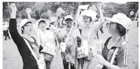
● 捍衛華教不落人後，女士們也積極參與抗議行動。