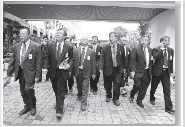
● 一行20人的董总代表团，正步行前往国会大厦。

尽管天公不作美，大清早即下起绵绵细雨，却无阻华教人士的热心，以行动体现力量，踊跃赴会。上午9时左右，从四面八方而来的参与者，相继抵达距离国会大厦约1公里外的默波草场聚集。来自檳城、柔佛、马六甲、霹靂、吉打、森美兰等州属的25辆巴士，陆续赶抵会场，展示了风雨同路的团结。