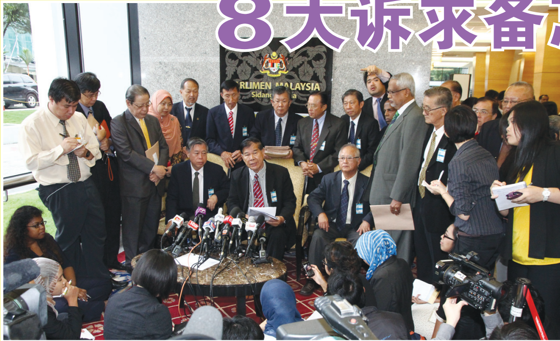
● 董总代表团提呈备忘录后，召开新闻发布会。