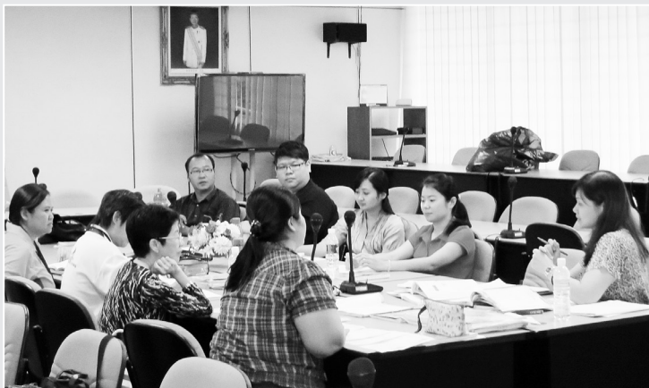
● 学科交流在进行中。

交流的目的地是实地了解教师对教材的使用情况及意见；促进各独中有关学科教师的经验交流；以及物色各学科人才，以加强教材的编写、修订及回馈工作。