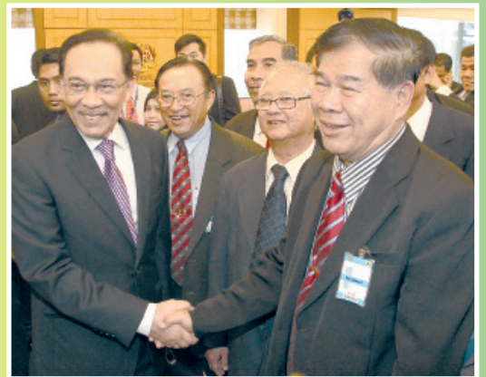
● 叶主席与国会反对党领袖拿督斯里安华（左）在国会握手问好。