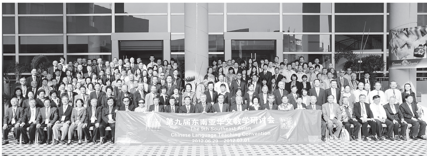
● “第九届东南亚华文教学研讨会”全体出席者大合照。