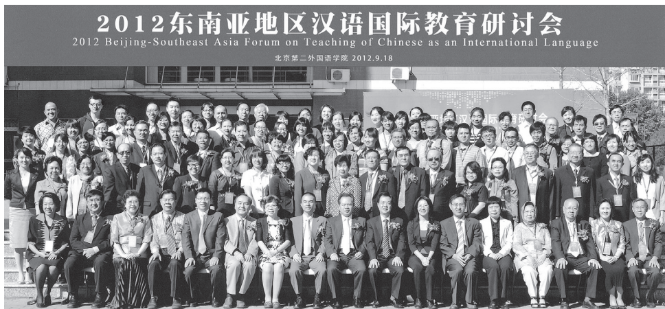
● 2012东南亚地区汉语国际教育高端研讨会出席者合影。（北京）

此项由北京市教育委员会主办，北京市汉语国际推广中心和北京第二外国语学院承办的国际教育研讨会，出席者有中国的专家学者，以及东南亚各国代表共250名参加。