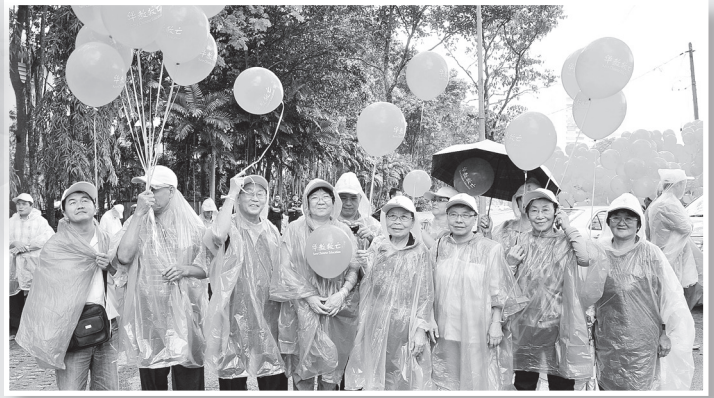
● 出席者撐傘穿雨衣，並戴上此次行動代表性的鴨嘴帽，手持“華教救亡”的氫氣球，冒雨出席支持。