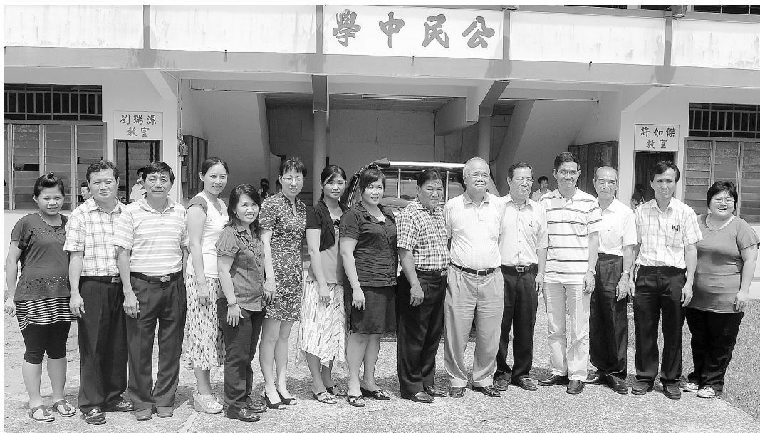
● 詩巫公民中學校董們熱烈歡迎講師和董總人員到來。

2 位講師針對《初中數學》初一至初三上下冊和《初中化學》上下冊“成功教育”模式教與學電子平台 (教案和課件) 的設計理念、框架、內容與應用，尤其是如何結合使用課本、教案和課件，進行了兩天的集中培訓。化學組除了講解，也進行了動手實驗的操作和指導。