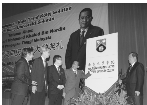
● 高教部部长拿督斯里卡立诺汀（左四）为南方大学学院新标志揭幕。

六百万令吉的费用，他希望华社能够秉持支持“民办大学”的精神，继续对南方大学学院的未来建设给予协助及支持。