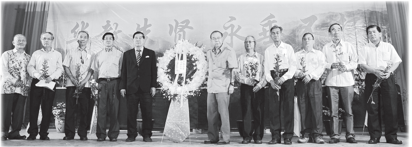
● 董总、各州董联会、董教总独中工委、董教总教育中心及独大代表在献花追思华教先贤时合影。

2012年10月21日，在一个没有上学的周末里，霹雳州怡保育才小学显得格外的热闹，礼堂内挤满了人潮，悠扬平和的音乐不断响起，来自全马各地的热心华教人士，聚集在这里，参与一年一度、意义深长的“华教先贤日”，场面肃穆感人。