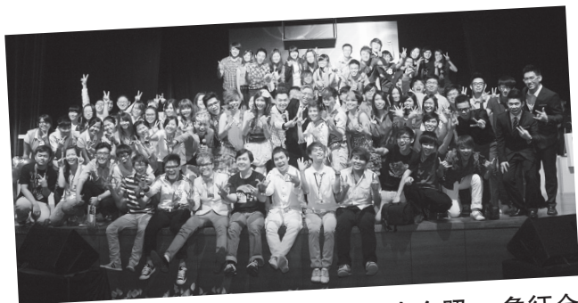
十大艺人与全体工作人员来张大合照，象征全年的十大义演圆满结束。

今年新纪元学院与英国City&Guild认证机构签约，准备开展一系列技职专业课程。同时，新纪元学院与马六甲中华工商会、雪隆姑苏慎忠行餐饮业公会、南大校友会、留台联总携手合作，为马来西亚中小企业发展，提供人才训练和业界交流，今后为学院发展带来新契机。