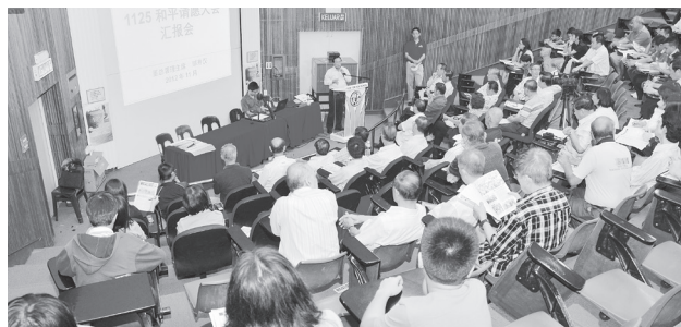
柔佛新山的汇报会，在宽柔中学杨文富讲堂举行。