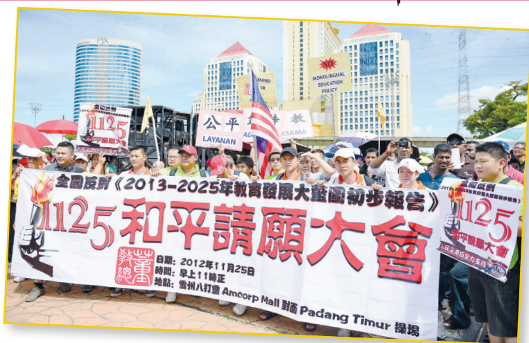
“1125和平请愿大会”在一片平和守次序的气氛下顺利举行。