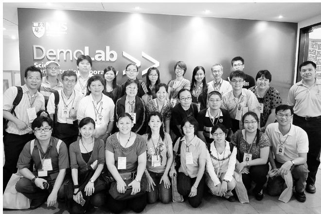
● 化学科教师参观“新国大理学院科学示范实验室”时摄。

化学科研习班共有5堂专题讲座、3堂实验技术示范、1堂讨论会、实地考察“化学分子与材料分析中心”和参访3个单位。