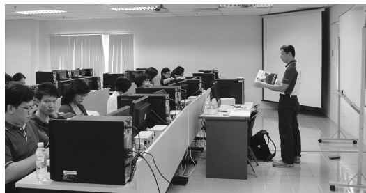
● 研习班学员上课情形。

参加研习班的教师除了自行负责国际旅费和行政费用等之外，在台湾上课期间的费用，包括住宿、膳食、交通、参观游览等，都是侨委会赞助。参加学习团的学生只须自付机票、在台生活费和行政等其余开销。这个团也获得国立台中教育大学的支持，协助课程的设计与编排。