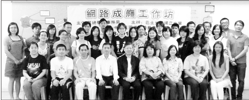
● “2012年网络成瘾工作坊”全体学员大合照。