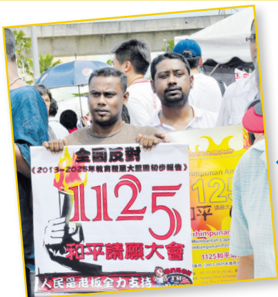
印裔同胞到场为母语教育争取到底。