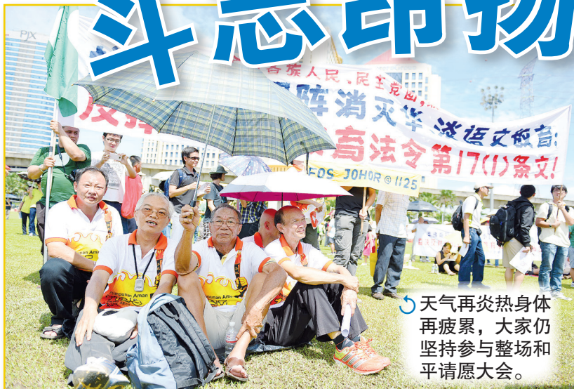
天气再炎热身体再疲累,大家仍坚持参与整场和平请愿大会。