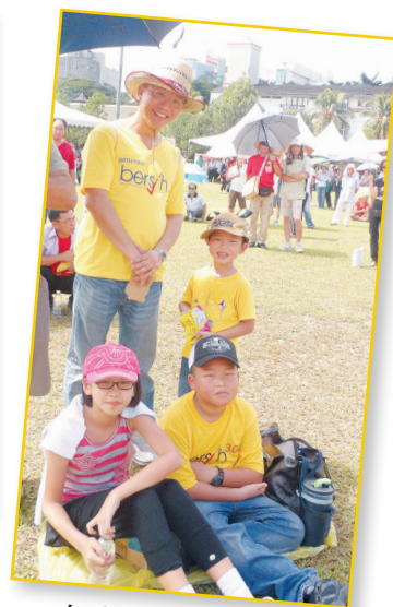
身穿黄色净选盟T恤的大人与小孩,抱着一颗热爱华教的心到场支持。