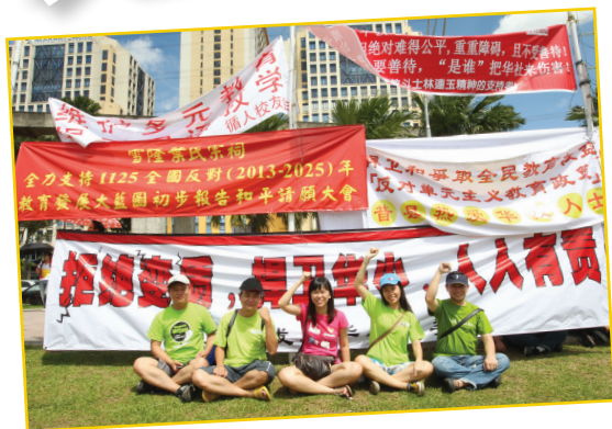
年轻人不畏烈日当空,同心协力挺华教。