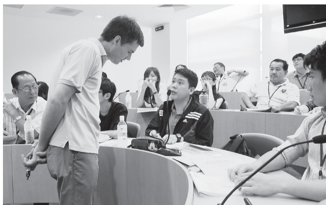
● 数学科教授针对教师提出的问题作面对面的交流。

南洋理工大学特别邀约三、四位就读于南洋理工大学的独中生前来分享求学经验，让教师从中得知大马独中生在南大求学的实际情况，了解学生升读大