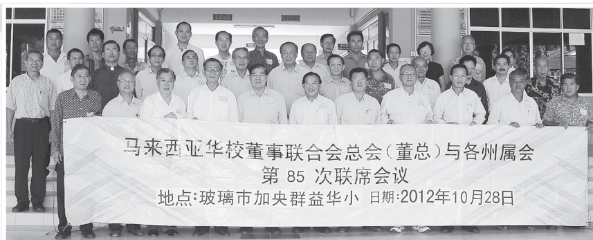
● 董总与各州属会代表合影。

董 总与各州属会第85次联席会议已于2012年10月28日在玻璃市州加央群益华小顺利举行，共有9个州属会的27位代表出席。各州代表经过充分的交流与讨论后，一致通过以下7项议决案：