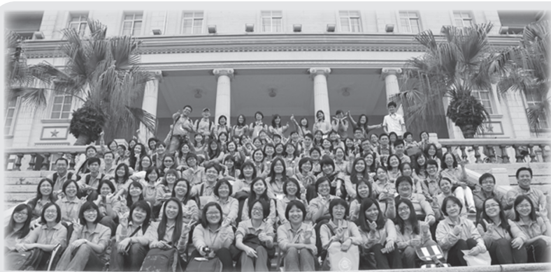
● “汉语教师来华教材培训班” 100位全体团员合照。