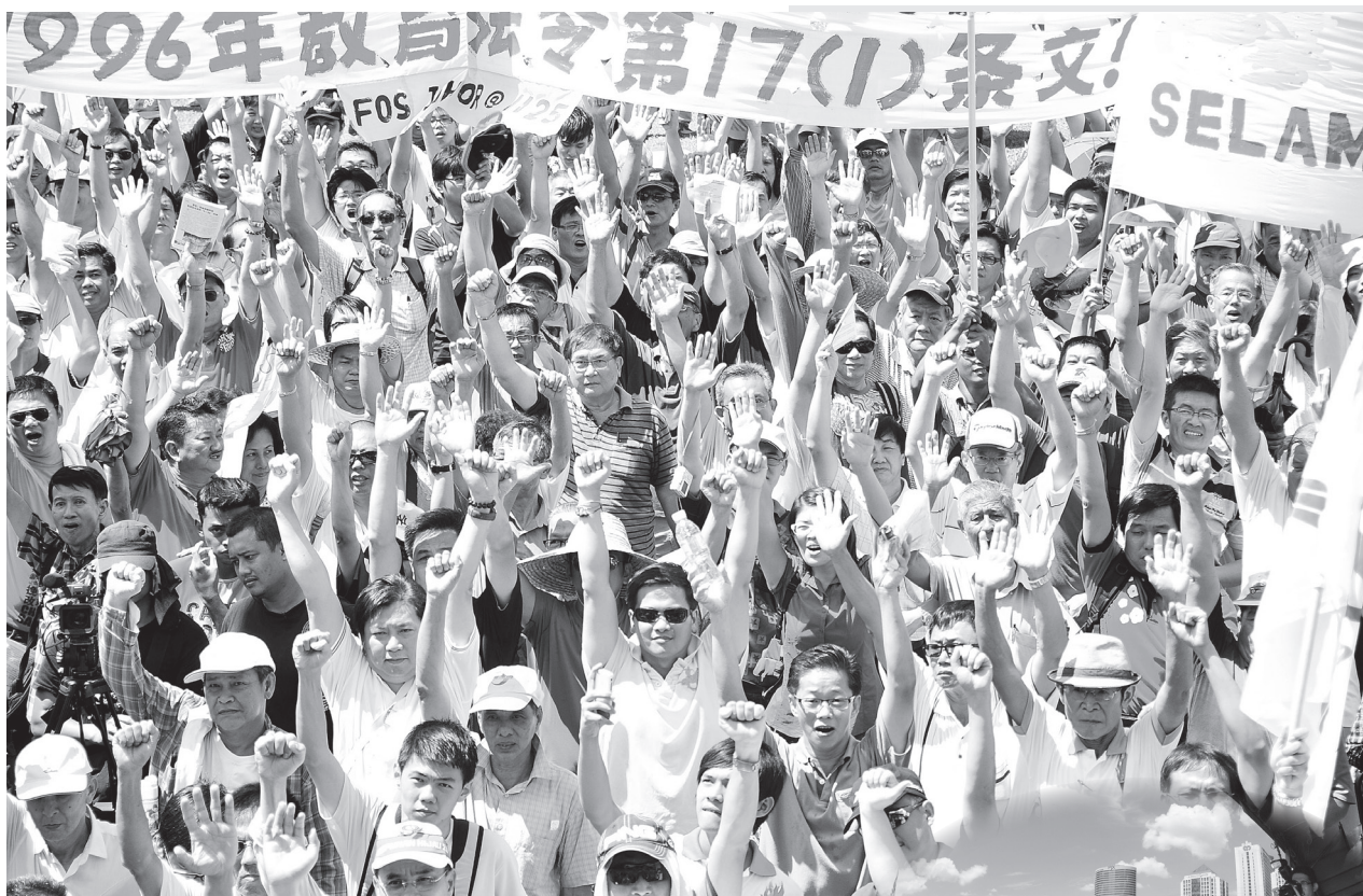
◎ 双手支持。 台上宣读大会提案时，台下群众纷纷高举

集会人潮中也出现不少友族脸孔，他们甚至高举起写了“民族正气”字眼的横幅，声援华教之余，也捍卫本身的母语教育。