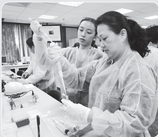
● 生物科教师进行“PCR/DNA Sequencing”实验操作。