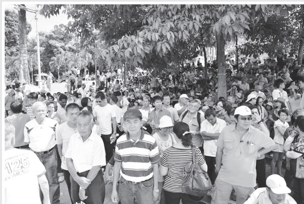
◎ 草场边的小山坡上也挤满了人潮，场面非常热烈。