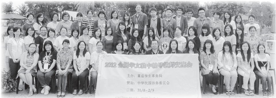
● “全国独中辅导教师交流会”全体参与教师大合照。

董总学生事务局于8月31日至9月2日，在加影Country Height休闲俱乐部举办了“全国独中辅导教师交流会”。交流会旨在提升辅导教师知能之专业性，以及促进校与校之间的辅导资源流通。