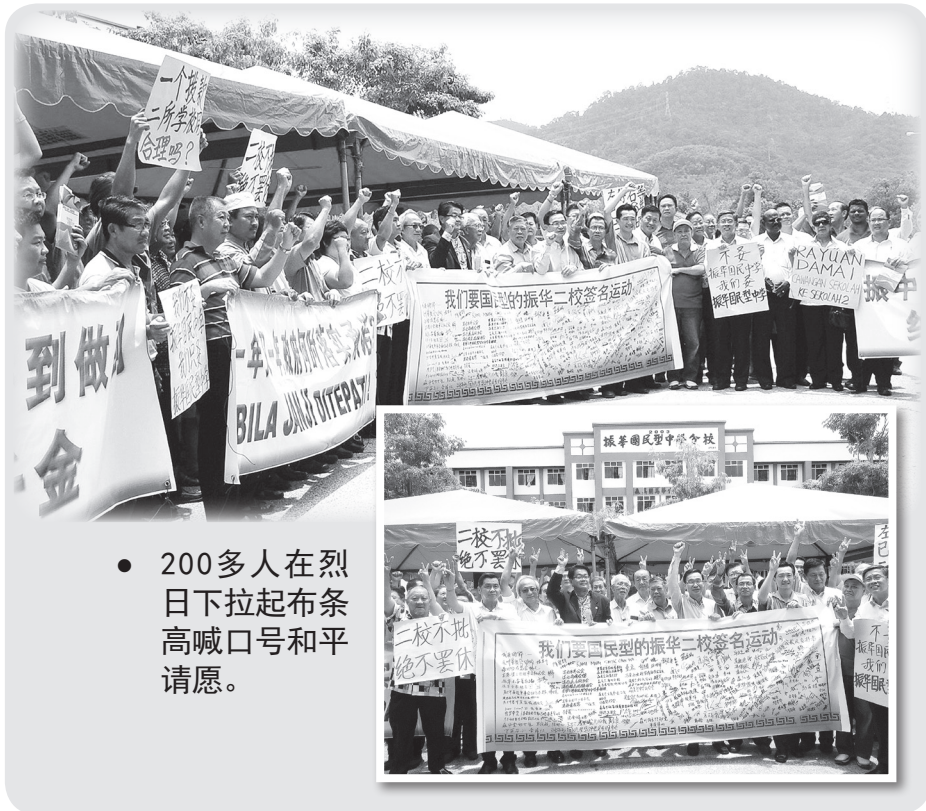
● 200多人在烈日下拉起布条高喊口号和平请愿。