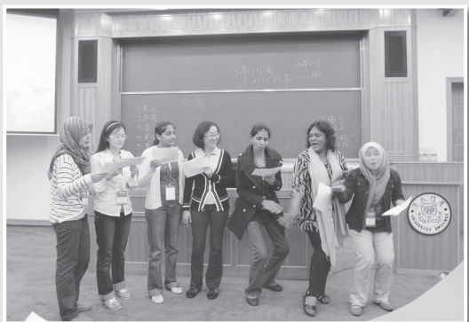
● “马来西亚华文独中教师学习汉语和推广教材培训班”学员上课情形。