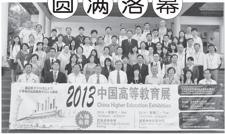
● 中国高等学府代表莅访董总，并合照留念。

董总自2003年开始推动中国高等教育展（简称“高教展”），迄今已走过八届，成功为我国中学毕业生开拓更广阔的升学道路。今年第九届中国高教展于4月20日及23日，分别在巴生滨华中学及宽柔中学古来分校举办，参展单位有来自中港澳区的30所高校及新纪元学院。据非正式统计，前来巴生滨华中学及宽柔中学古来分校观展的人数分别计有2千5百人左右，总人数将近5千人。