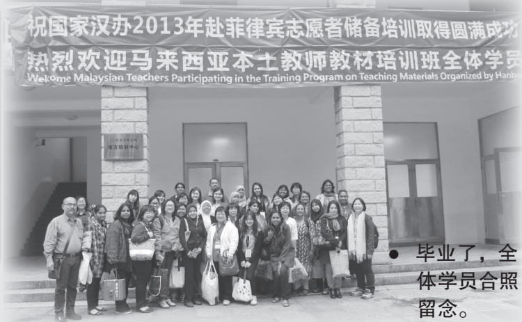
● 毕业了，全体学员合影留念。

2013年3月26日至4月1日，由中国国家汉办东南亚事务代表处主办、董教总独中工委教师教育委员会受委托协办，组织马来西亚华文独中教师赴厦门大学汉语国际推广南方基地接受汉语培训和推广教材培训活动圆满举行。