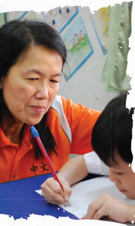
华小生初步接触数学和科学科目时，若以本身母语学习会较容易吸收相关的知识，也是最有效的学习语言。