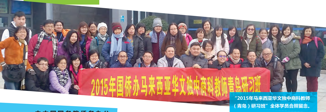
“2015年马来西亚华文独中商科教师（青岛）研习班”全体学员合照留念。