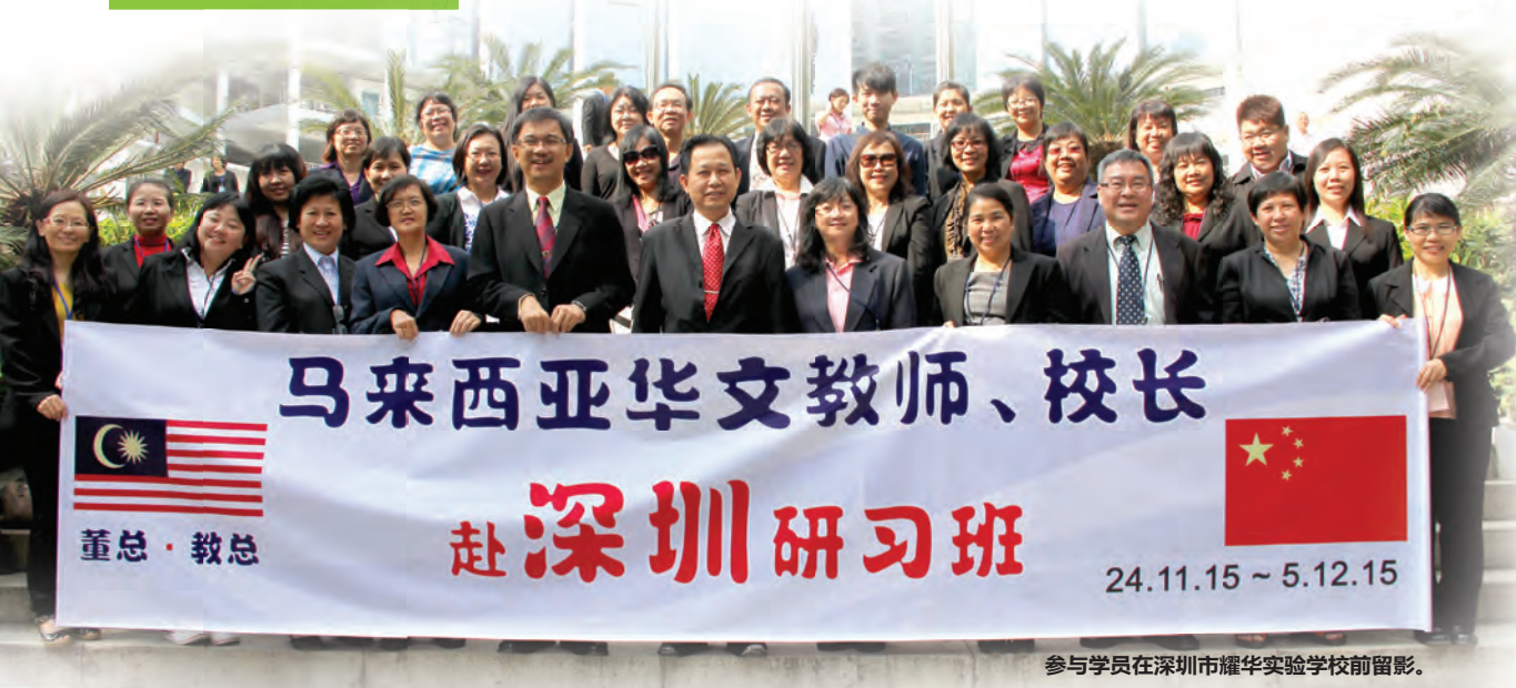
参与学员在深圳市耀华实验学校前留影。

由中国国务院侨办文化司主办、深圳市侨办协办、深圳市耀华实验学校承办的“2015年华文教师·校长研习”马来西亚班于2015年11月24日至12月5日，在深圳市耀华实验学校圆满举行。此项研习课程目的为加强在海外华校联系，提升学校管理水平。研习课程包括学校管理知识、文化讲座、课堂教学观摩、参观与参访活动。