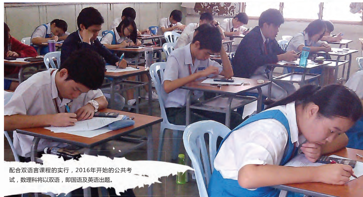
配合双语言课程的实行，2016年开始的公共考试，数理科将以双语，即国语及英语出题。