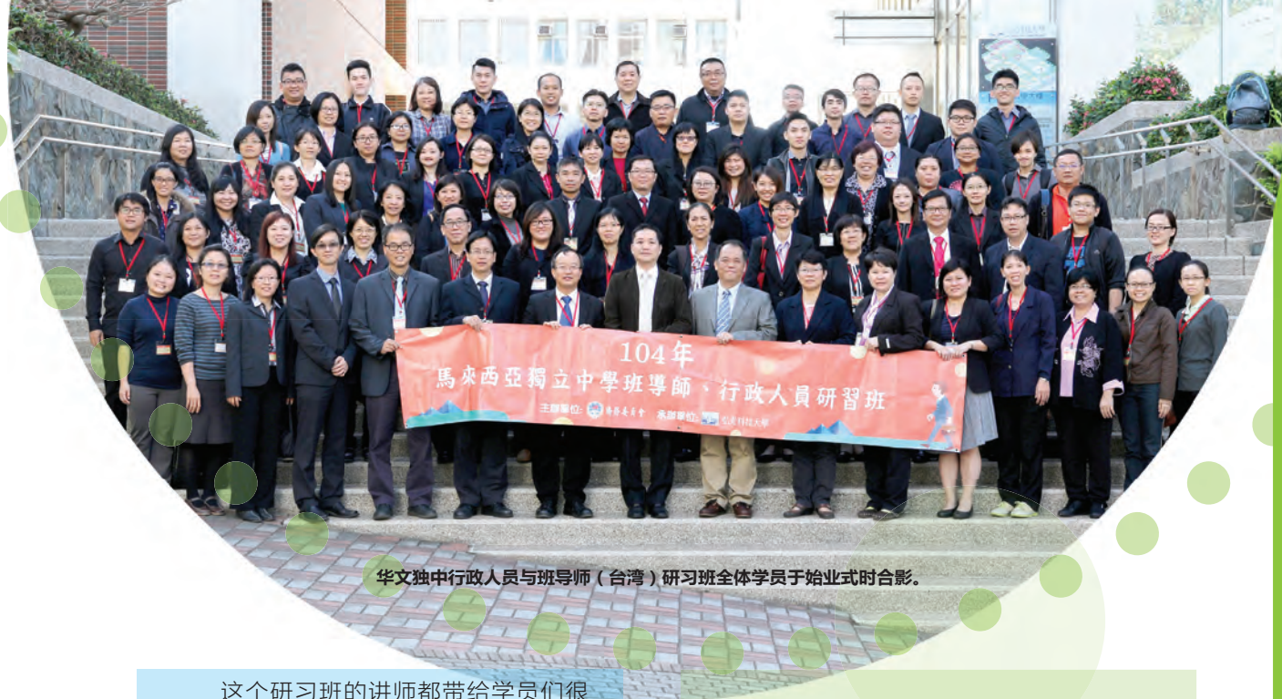
华文独中行政人员与班导师（台湾）研习班全体学员于结业式时合影。

由中华民国侨务委员会主办、台中弘光科技大学承办，董总协办的“2015年华文独中行政人员与班导师（台湾）研习班”于2015年11月29日至12月17日在台湾台中弘光科技大学举行，这是董总首次组织华文独中班导师赴台研习，而行政人员班则是睽违11年后再次举办。