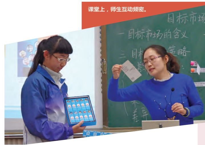
课堂上，师生互动频密。

由中国国务院侨务办公室、中国海外交流协会主办的“2015年马来西亚华文独中商科教师（青岛）研习班”，已于2015年12月10日至12月26日圆满结束。