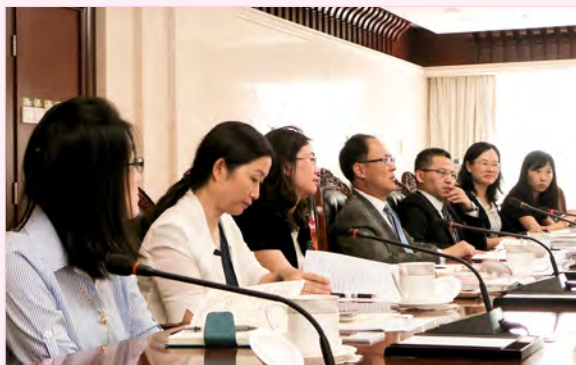
董总访问团莅访中华人民共和国教育部时，获得方军副司长（中）热情接待。