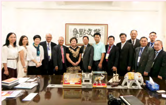
访问团与中国华文教育基金会代表合照留念。

随着独中教育不断发展，教师教学水平不断提升，对学校领导的要求也相应地提高。因此，华文独中校长和行政人员要能够不断改进学校的领导工作并进一步推动独中教育的改革，行政人员本身的在职进修与经验交流将是最大的关键。因此，董总有意为华文独中行政人员开办“华文独中校长与行政人员培养培训课程”，为学校培养和储备教育管理人才，永续经营和发展华文教育。培训班的开办将是华文独中教育工作者向中国学者取经，并参考中国学校校务经营和教育改革经验的好机会。