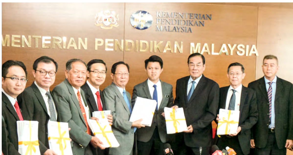
七华团移交备忘录及反对在华小推行“双语言课程计划”签名表格予教育部副部长张盛闻（右四）。

10月5日，董总与教总等七华团拜会教育部副部长张盛闻，向副部长表达华社反对在华小推行“双语言课程计划”的立场，同时也把备忘录和签名表格一同提呈，冀望教育部能正视“双语言课程计划”在华小推行的负面影响。