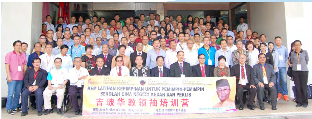
“吉坡华教领袖培训营”全体参与者合影。

由董总主催、吉打华校董事联合会主办，玻璃市华校董事联合会协办的“吉坡华教领袖培训营”已于2016年7月29日至30日在浮罗交怡Hotel Langkasuka顺利举办。此培训营获得吉打州和玻璃市州内48所学校共155名教育工作者参加。