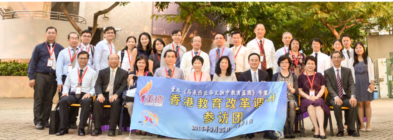
参访团在东涌可誉中小学拜会香港中学校长会。

2015年为董总发布《独中教改纲领》十周年，当其时已有不少华教有识之士公开呼吁华教同道正视目前独中教改的落实情况，检讨独中教改措施，并在《独中教改纲领》的基础下，重新拟定独中新一波的发展策略。董总顺应这股呼吁，於今年初正式成立马来西亚华文独中蓝图专案小组，主要工作是计划以三年为期，搜集、调研和检讨现行独中教育办学状况，且借镜当前国际教育经验，并因应未来社会发展趋势，拟定未来十年马来西亚华文独中教育的发展蓝图，深化独中教育改革。