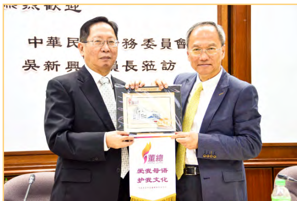
主席刘利民赠送纪念品予吴新兴委员长（右）。

台湾侨务委员会吴新兴委员长于2016年8月5日莅访董教总，陪同者包括驻马台北经济文化办事处章计平代表，侨委会侨生处庄琼枝处长，驻马台北经济文化办事处侨务组林渭德组长和侨务组林素珠秘书。新上任的吴新兴委员长首次来马，获得董总主席天猛公拿督刘利民和教总主席王超群率领一众中委、理事热烈欢迎。