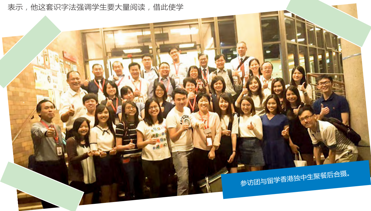
参访团与留学香港独中生聚餐后合影。

10月1日参访团返抵吉隆坡，结束为期七天的教育参访观摩之旅。专案小组要求参访团成员在参访结束后一个月内提交参访观察和心得，并择日举办分享会，对参访内容做整理、总结和检讨，以供草拟独中教育蓝图之参考。