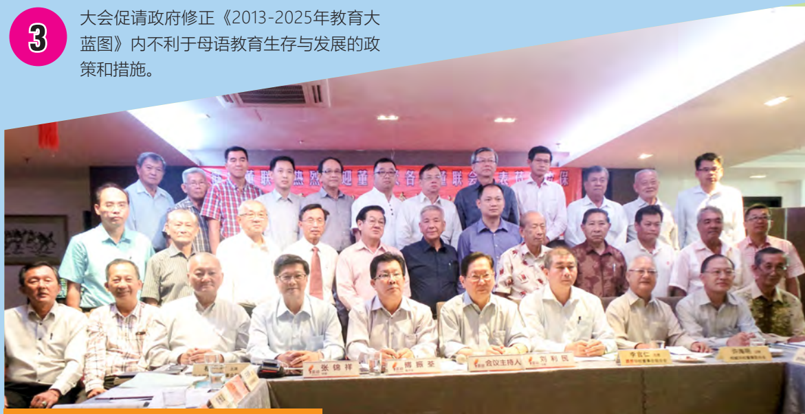
董总各州属会代表出席在怡保举行的董总与各州属会第89次联席会议。