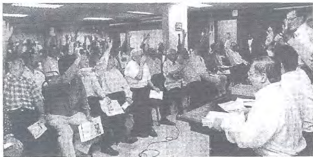
●全校 78 所華校代表踴躍出席“反對剝奪董事會權力抗議大會”，一致通過兩項提案。