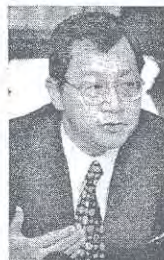
馮鎮安：華小董事部有權在學校2個戶口的支票上簽名。

【吉隆坡7日訊】教育副部長馮鎮安日前發出公函，指各州教育總監收回指示，撤銷董事部小董事部在學校支票簽署的權力。 副教育部長馮鎮安日前表示，請各州教育總監收回指示，撤銷董事部在學校支票簽署的權力，並到董事部有權在學校2個戶口的支票上簽名。 他呼籲華小董事部不要灰心，繼續保持原狀，爭取在支票簽署。 他說：“除了收回指示及保持原狀，我們將研究這個問題，俾財政部反映華小的特征及董事部原來扮演的傳統角色，希望財政部能開一而二，給予華小董事部永久簽署的權力。” 馮鎮安今天在辦公室舉行新聞發布會，針對華小支票簽署名義及這樣說。 他解釋說，一般華小都有兩個銀行戶口，一個為政府撥款戶口，另一個則是學校股東取得盈餘的戶口。 他指出，教育總監日前發出公函，指示各州教育總監收回指示，撤銷董事部在學校支票簽署的戶口簽名，而財政部則建議撤銷政府撥款戶口，使到董事部有權在2個戶口簽名。 他說，過去幾十年來，華小董事部在處理學校財政上都不曾出過錯，反而對學校貢獻良多，不時慷慨捐助學校。 “華小董事部的勞苦是有目共睹及不容抹殺的，許多時候，董事部也協助學校應付日常行政開支，尤其是學校水電費太多，他們也愿意出錢出力。” 他指出，教育部長翁嘉慧時常也認同華小董事部的傳統支票，希望財政部反映後，一切能夠恢復原狀。