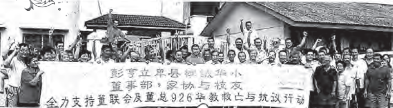
星洲日报 17 SEP 2012 (立卑16日讯)