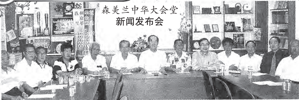
森美兰中华大会堂 新闻发布会