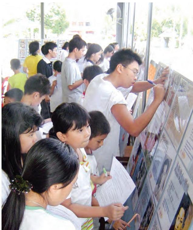
在参观资料展的同时，孩子们认真填写华教常识比赛表格。

美食以美食街的方式展示在大家的眼前，每一样的佳肴都洋溢着社区特有的、满满的情感。