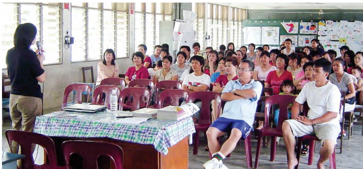
亲子教育讲座传达父母亲亲子教育的重要性。