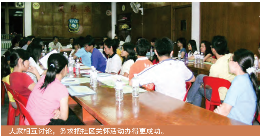
大家相互讨论，务求把社区关怀活动办得更成功。

社区关怀活动带动家庭、学校和社区三结合。家庭教育、学校教育和社区教育是社会大教育的三大元素，家庭教育是学校教育的基础，社区教育是学校教育的延续。大大小小、男男女女、老老少少齐心合力推动社区教育，构成社区关怀活动的全家福。