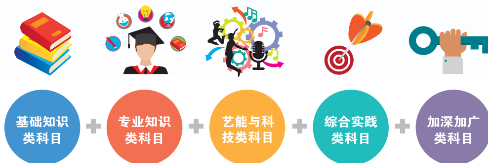
图 4： 高中类科课程架构

依据《独中教育蓝图》建议 10 ，以及高中课程发展整体规划的需要，《总纲》建议高中课程架构规划如下：