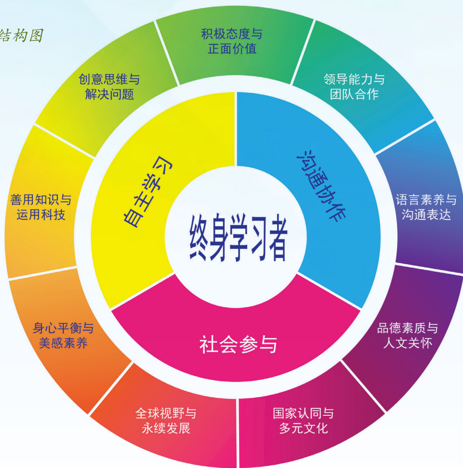
图 1： 核心素养结构图

图1展示独中课程发展以培养学习者的终身学习为轴心，扩展成为“成就孩子”的三个理念，即自主学习、沟通协作与社会参与。核心素养结构图的外圈以颜色光谱的方式呈现，揭示九项素养融合三大理念的内涵，内外圈线条不对齐进一步阐明每一项素养的落实都包含了三大理念的贯彻。基于统整融汇的大原则，同时兼顾具体落实的可行性，《总纲》将每一个理念以三项素养来推展，其详细说明如表1所述。