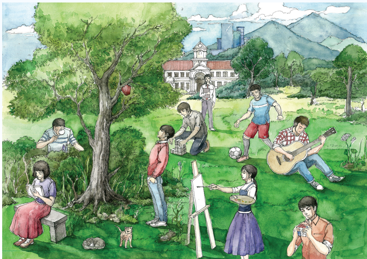
作者：李俊为——“乐教爱学”图

1.自主学习：体现在“学生作为学习主体”的学习过程中。学习者首先能够检视自己在学习和成长过程中的经验，为自己的生命创造幸福，并为身心发展带来助益，懂得欣赏生活中的美好事物，展现正向积极的心态。学习者也能够掌握知识和各类符号，懂得善用资讯科技工具提升个人学习，克服学习疑难。并在此基础上，进一步探究未知的领域，发挥创新精神，解决日常生活中所面对的各种议题和挑战。