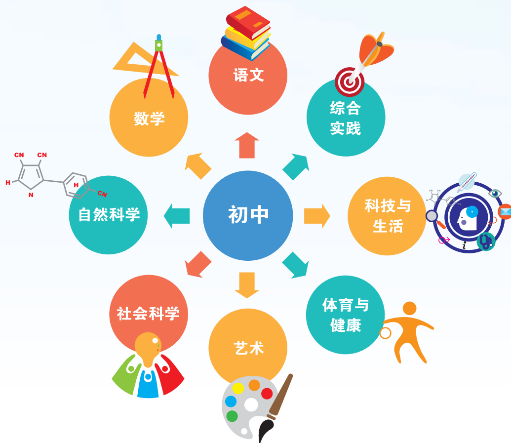
图 3： 初中学习领域课程架构

依据《独中教育蓝图》建议 8 ，以及初中课程发展整体规划的需要，《总纲》建议初中课程架构规划如下：