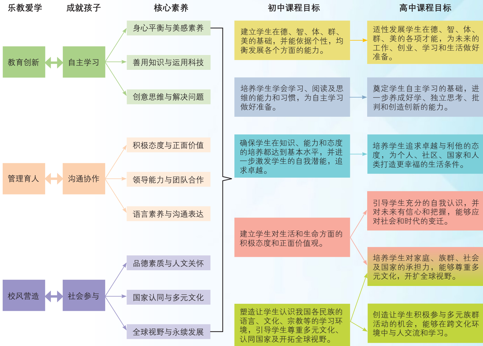
理念、核心素养与课程目标关系图